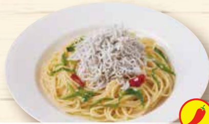
九条ネギとシラスの ペペロンチーノ ¥1,260