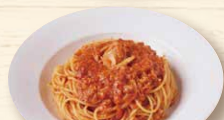
ツナのトマトソース煮込み ¥1,150