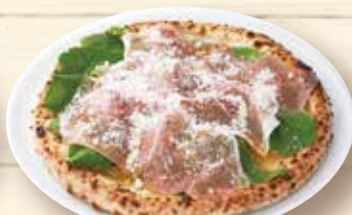
生ハムとルッコラ ¥1,710