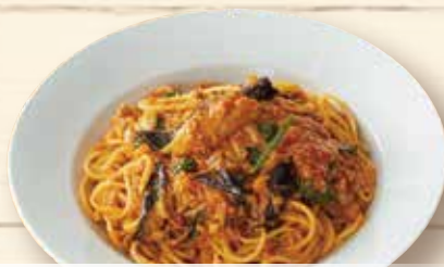
揚げ茄子とほうれん草の ミートソース 田舎風 ¥1,260