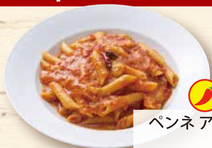
ペンネ アラビアータ ¥1,210