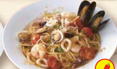
イタリア産カラスミと 魚介のペペロンチーノ ¥1,460