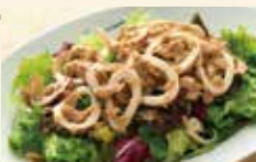
イカとツナのサラダ ¥1,120