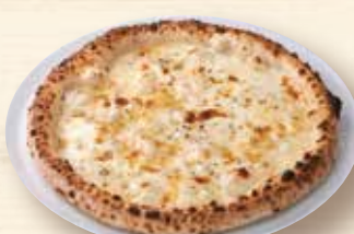
クアトロ・フォルマッジ ¥1,670