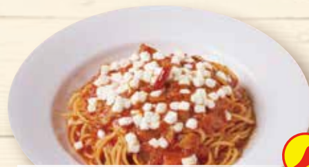
トマトとニンニクと モッツアレラ ¥1,320