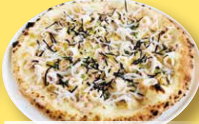
たらこマヨの シーフードピッツア ¥1,780