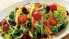
いろいろ野菜の 菜園風サラダ ¥1,090