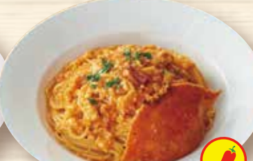
渡り蟹の トマトクリーム ¥1,330