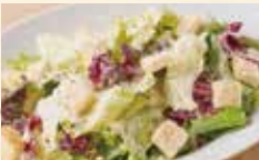
カプリチョーザの シーザーサラダ ¥1,100