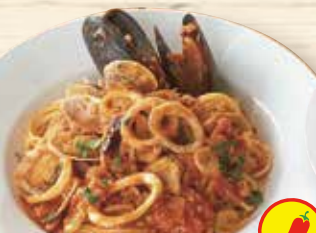
ペスカトーレ漁師風 トマトソース ¥1,290