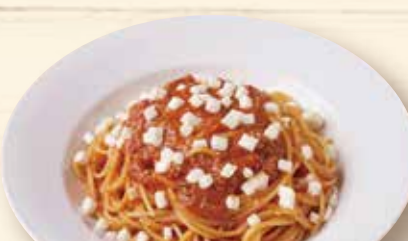
モッツアレラチーズの ミートソース ¥1,260