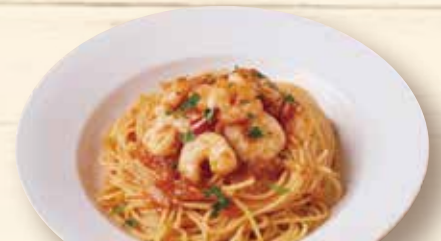
エビのスパイシー トマトソース ¥1,320