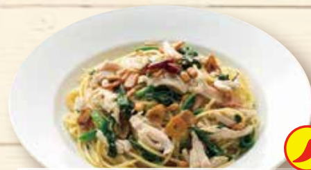
蒸し鶏とほうれん草 松の実の ペペロンチーノ ¥1,150