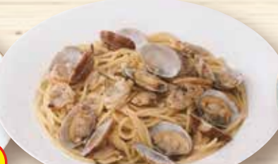
黒胡椒を効かせたアサリの スープ仕立て ¥1,150