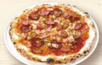
クアトロ・ピカンテ ¥1,580 ⚠️ お子様はご遠慮ください。