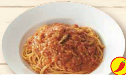
トマトとニンニク ¥1,150