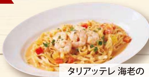
タリアッテレ 海老の トマトクリームソース ¥1,570