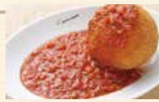
シチリア風ライスコロッケ、 ミートソースがけ ¥860