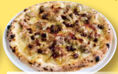
南蛮みそとゴロゴロした豚肉の スタミナピッツア ¥1,780