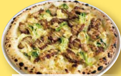
てりやきチキン ピッツア ¥1,780